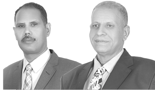
أسرة الدراسات الإقتصادية