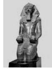
حتشبسوت تحتمس الثالث